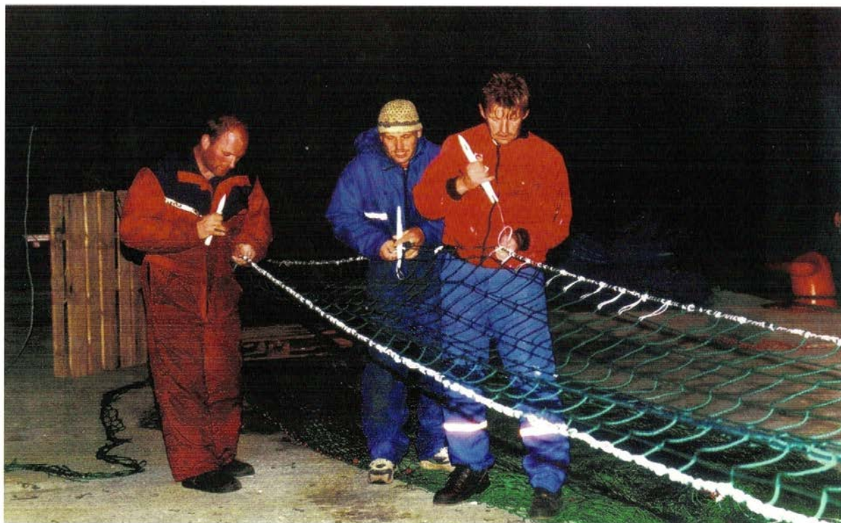
Bilde 2. Produksjon av horisontalt skillepanel til montering i forlengelse på snurrevad. Mannskap på M/S "Svein Frode", Svartneshamna, september 1998.