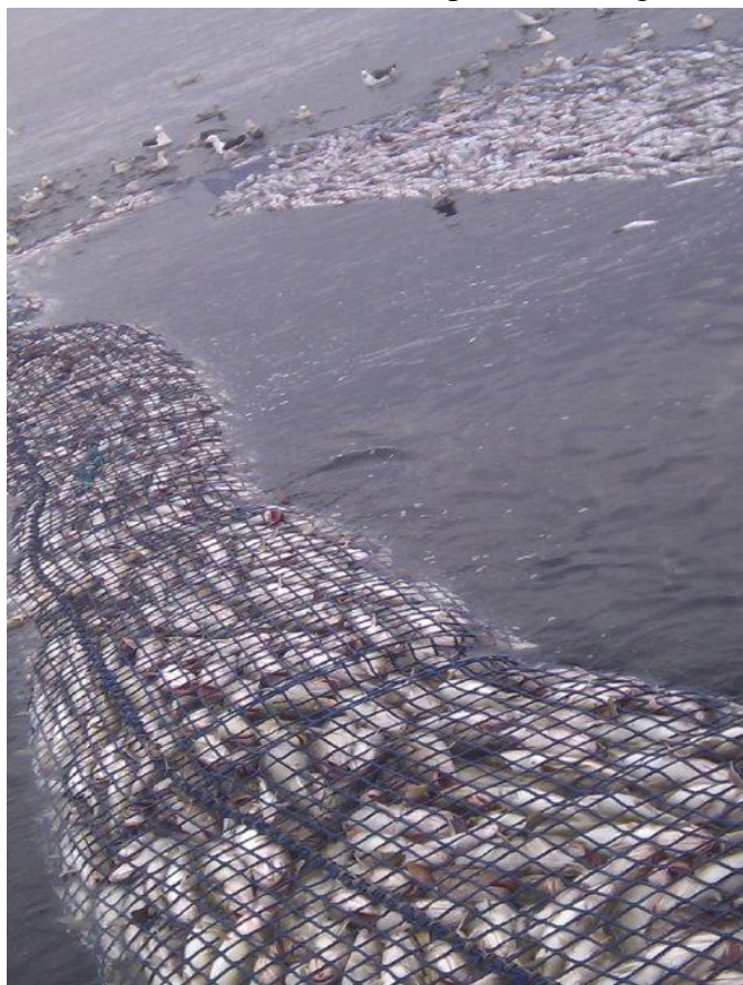
Bilde 3. Kvadrat maskepose samt mye av forlengelse/belg full av torsk, estimert til ca 40 tonn.

Mannskapene på de to små snurrevadfartøyene som var charteret til forsøk med parsnurrevad ("Rubin" og "Vesterbøen"), var svært tydelig på at fangstbegrensning i snurrevad kunne være forskjell på suksess eller katastrofe. De hadde vært med på hal opp i 40 tonn, og bare hell og godt vær hadde berget bruk (bilde 3) og båt. For disse båtene var 5 tonn maksimum av hva de klarte å håndtere på et fornuftig vis.