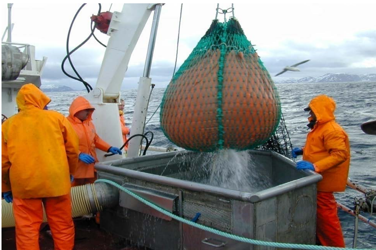
Bilde 4. Lerret/pressningsylinder montert inne i sekke-løftet. Fisk løftes om bord i en form for vannbad, og utsettes for langt mindre press en når den løftes om bord tørr i løft kun bestående av masker.

nett, lin eller presenning som var i selve løftet. Løftets misjon ville i alle tilfelle kun være å transportere fisk fra kvadratmaskeposen og om bord i fartøyet. Og med innmontert lerretsløft, ville dette bli gjort på en svært skånsom måte i og med at fangsten ble løftet om bord i en form for vannbad (Bilde 4). Lerretsløftet ville først og fremst kunne gi en gevinst under hysefiske, men også for torsk burde en kunne oppnå bedre kvalitet med lerretsløft i stedet for vanlig maskeløft.